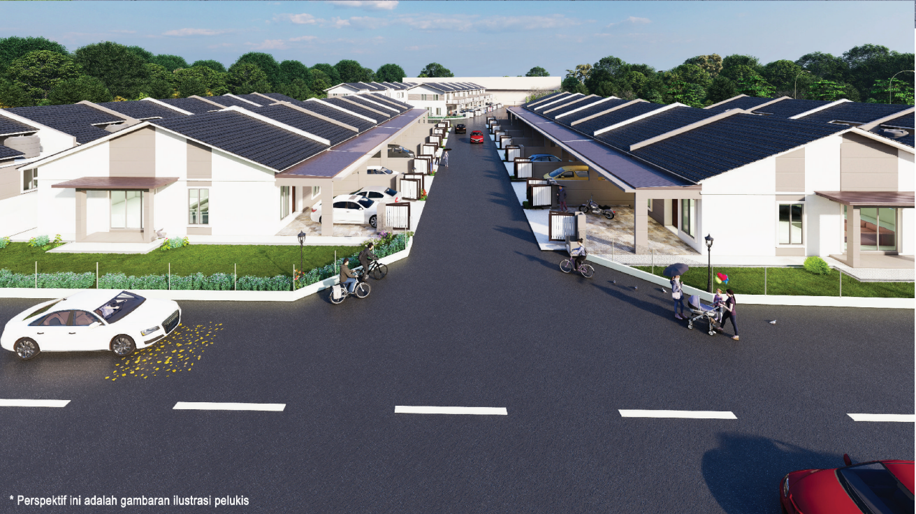
* Perspektif ini adalah gambaran ilustrasi pelukis